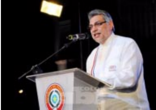
Presidente de la República.