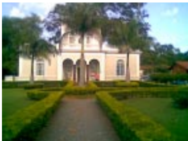
Sucursal del Palacio de López como Ministro Secretario de Deportes del Gobierno Nacional

PARAGUAYOS Y PARAGUAYAS DESDE EL 2 Y 3 DE FEBRERO DE 1989 El pueblo es soberano; el gobierno es su creación y su propiedad; los funcionarios son sus servidores.