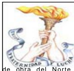
de obra del Norte

por medios violentos o con el "auxilio de la ley". Así, mediante esta política de rapiña, de inescrupulosidad, ya esencialmente imperialista, los Estados Unidos se convirtieron rápidamente en la nación más grande y más poderosa de todo el continente. La nación norteamericana se termina de conformar, repetimos, al finalizar la llamada Guerra de Secesión en 1864. ¿En qué consiste esta guerra de Secesión? Decía hace rato que la gente que pobló el Sur, se dedicó principalmente a la agricultura: sembradores de tabaco y algodón, cultivos que entonces tenía un gran mercado internacional, lo hacían todo a base de mano de obra esclava. Aquí empieza la emigración de la mano