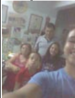
El 30 de diciembre de 2014 cumplió años nuestro director