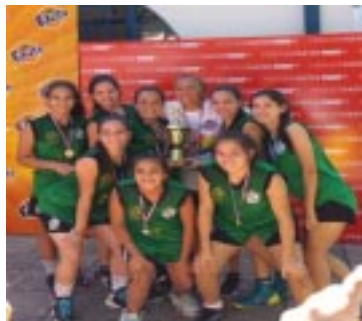
EQUIPO FEMENINO DE BASQUETBOL DEL MONSEÑOR LASAGNA GANA SU PRIMER CAMPEONATO INTERCOLEGIAL DEL 2015 EN EL SIL

PARAGUAYOS Y PARAGUAYAS DESDE EL 2 Y 3 DE FEBRERO DE 1989 El pueblo es soberano; el gobierno es su creación y su propiedad; los funcionarios son sus servidores.