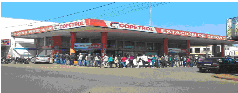
Foto de la compra venta de votos en Pedro Juan Caballero

El candidato plutócrata es un candidato seductor, sin duda alguna.