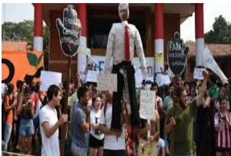
REVOLUCION ESTUDIANTIL MADURA UNIVERSIDAD NACIONAL DE ASUNCION

PARAGUAYOS Y PARAGUAYAS DESDE EL 2 Y 3 DE FEBRERO DE 1989 El pueblo es soberano; el gobierno es su creación y su propiedad; los funcionarios son sus servidores.