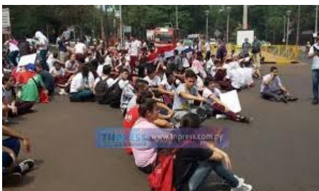
REVOLUCION ESTUDIANTIL ADOLESCENTE COLEGIOS