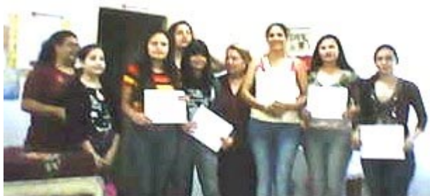
Fotos de la última promoción 20-11-2010

anónimas, el Juez de Primera Instancia en lo Civil y Comercial ordenará la inscripción de la sociedad en el registro correspondiente.