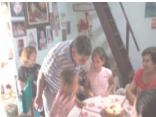
Nuestro Director apagando una velita más ayudado por los nietos.

El subsidio Estatal a los Partidos Políticos, es un deber de primera magnitud del Estado, ya que la plata del Estado debe ser utilizada en primer lugar en favor del Soberano, es decir de los propietarios del estado: El Pueblo en General.