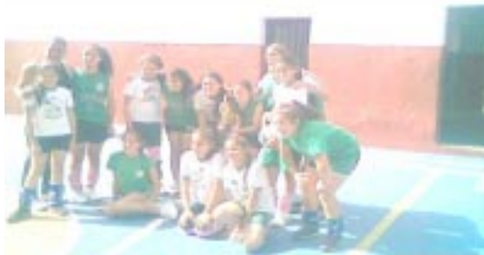
Campeonas de Voley Sub-12