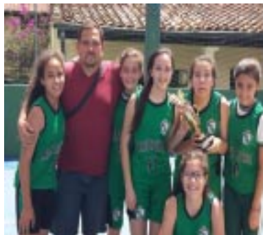
Campeonas de Basquet Sub-15