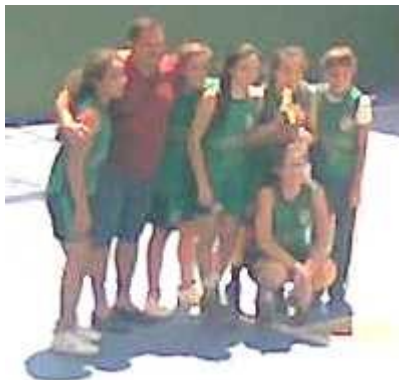
Campeonas de Basquet Sub-12

NUEVAMENTE LAS NIÑAS DEL MONSEÑOR LASAGNA HACEN UN TRIPLETE EN EL INTERCOLEGIAL DEL INMACULADO CORAZON DE MARIA